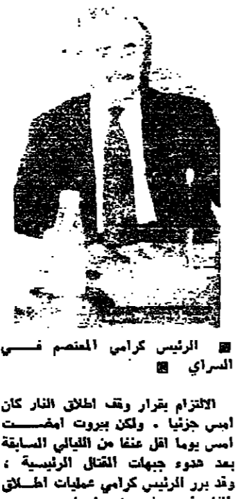
الرئيس كرامى المنضم سى السراي